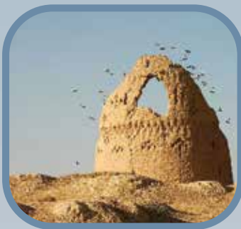
• کبوترخانه‌ای در سمنان

نکته‌ی عجیب: فضله‌ی کبوترها دارای فسفر و نیتروژن است. در قدیم از فضله برای تولید باروت یا برای دباغی چرم استفاده می‌کردند.