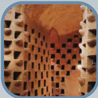
• کبوترخانه‌ای در میبد که جزو فهرست